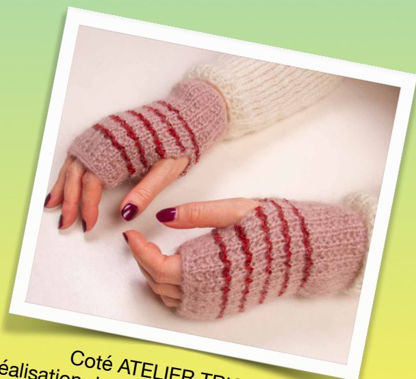
Côté ATELIER TRICOT Réalisation de mitaines (débutant et plus)

Des précisions supplémentaires sur les fournitures à apporter, vous seront communiquées lors de votre inscription