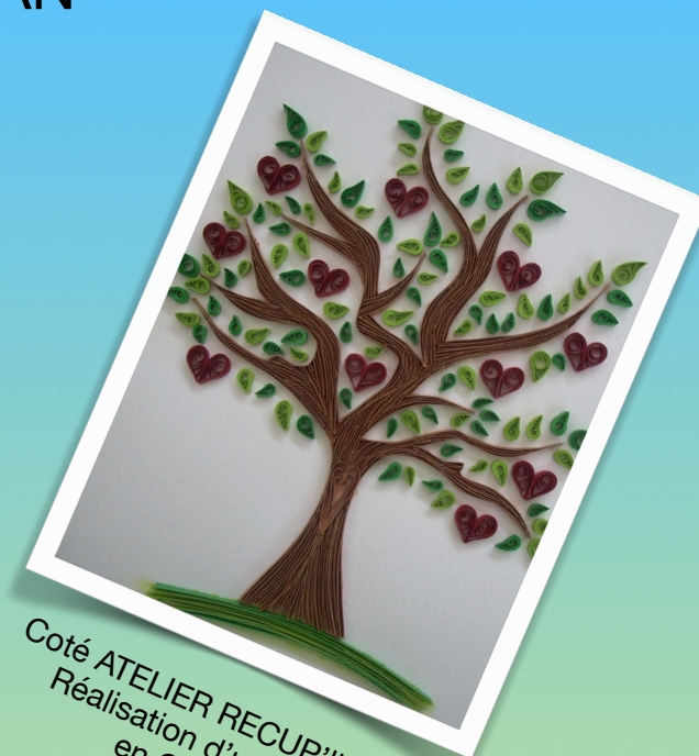
Côté ATELIER RECUP'livres Réalisation d'un arbre en Quilling

Inscription obligatoire auprès de la bibliothèque uniquement, aux heures d'ouverture, avant le 15 février 2023