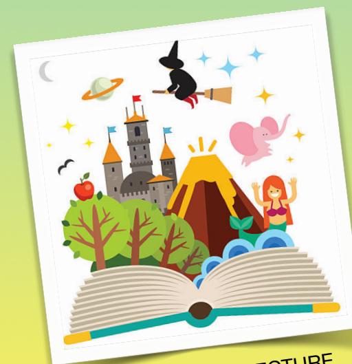
Côté ATELIER LECTURE Histoires lues aux plus petits